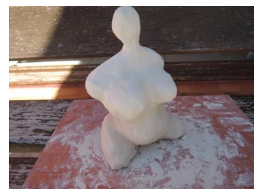
A la manière de Nicky St Phalle