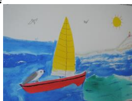
Carte relief encre